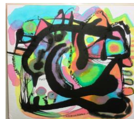
No.1 動く形を楽しもう