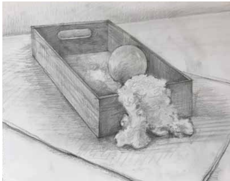
講師 習作 「箱と綿 硬と柔」

この教室では初心者向けの簡単な小振りなモチーフを描きます。ひとりひとりに寄り添った丁寧な指導で、初心者でも安心して始められます。基礎から丁寧な指導により、モチーフ（対象）を実感しながら描き出し、個性ある表現へと発展させていきます。