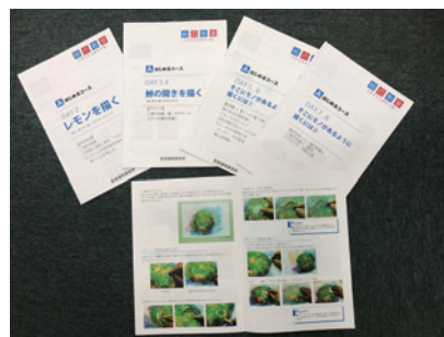
合計60ページに及び、丁寧なテキストがついています