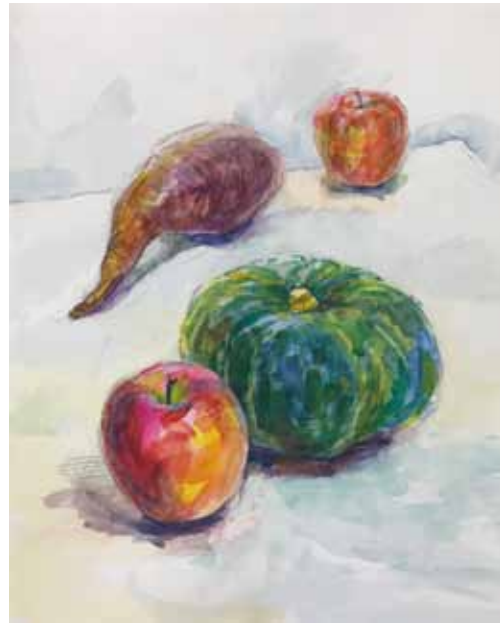
講師 習作 「実り」