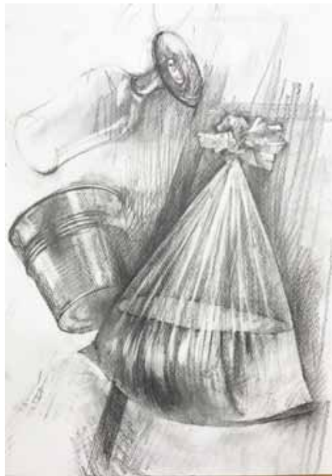
講師 習作 「吊るされた物 重さ」

絵を描くにはちょっとしたコツがあります。ひとりひとりに寄り添った丁寧な指導で、初心者でも安心して始められます。様々なモチーフ(対象)を実感しながら描き出し、個性ある表現へと発展させていきます。