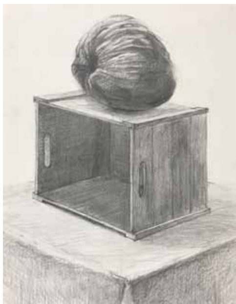
講師 習作 「椰子の実」

絵を描くにはちょっとしたコツがあります。ひとりひとりに寄り添った丁寧な指導で、初心者でも安心して始められます。様々なモチーフ(対象)を実感しながら描き出し、個性ある表現へと発展させていきます。