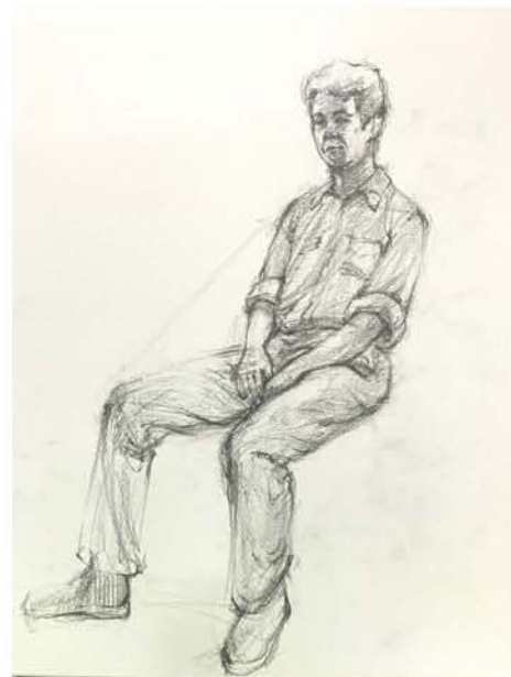
講師 習作 クロッキー