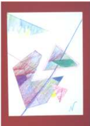
No1. フロッタージュパズル