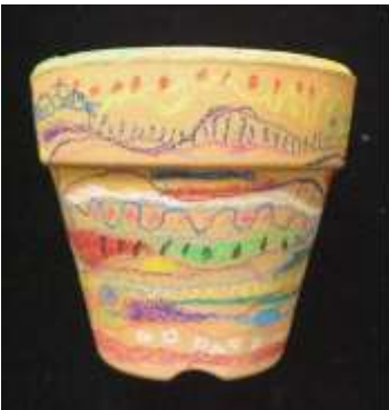
No4. 植木鉢に描く線のアナログ画