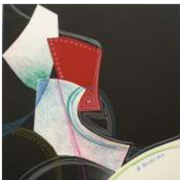
No9. コラージュパズル