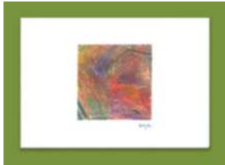
No2. ポストカード・美しい色面