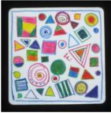
No11. コースターに描く