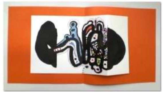
No3. なにか不思議な形 (カード仕立て)