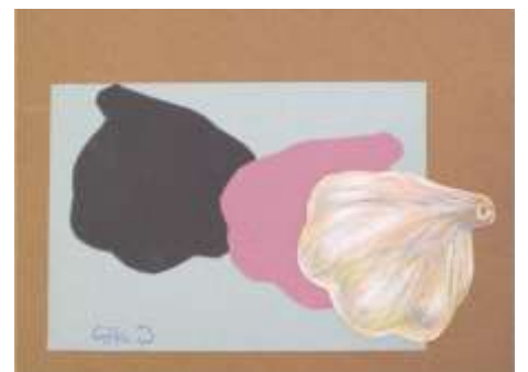
No8. にんにくの量感画