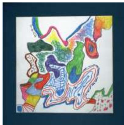
No10. 蝶の軌跡のデザイン画