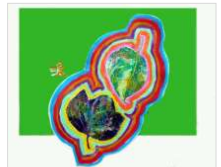
No.18 「ステンシルで描く葉っぱ」