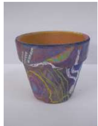
No.6 「植木鉢に描く地中のアナログ画」