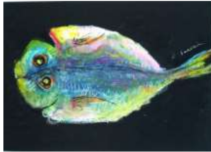
No.2 「アジの開きを描く」