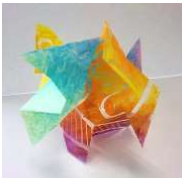
No.16 「色面と空間の コンポジション」