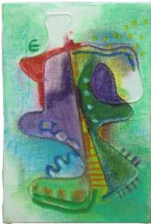
No.13 「アナログ・ フロッタージュ」