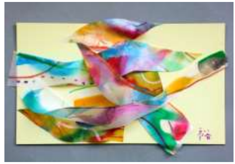
No.15 「風の流れのコラージュ」