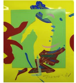
No.22 クロッキーコラージュ(人物)