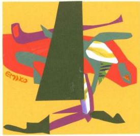
No.19 色のコラージュ(音)