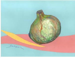
春 1 新玉ねぎの量感画