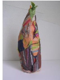
春 7 紙素材で作る立体 筒