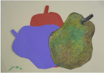
秋 1 洋なしの量感画