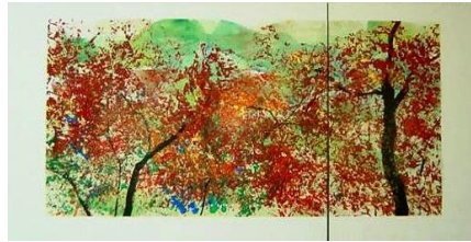
秋 7 紅葉屏風