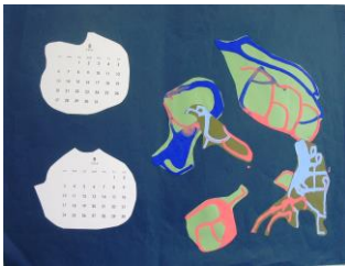
春 5 カレンダー ドリッピング