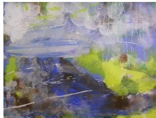
夏 3 梅雨のガラス絵