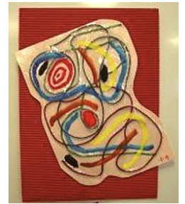
秋 8 即興画JAZZ