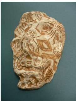
冬 1 京芋のスクラッチレリーフ