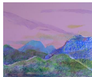
冬 9 春の山を描く