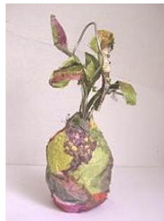
夏 7 紙素材で作るパイナップル