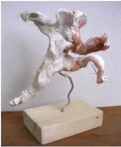
秋 5 粘土クローキー