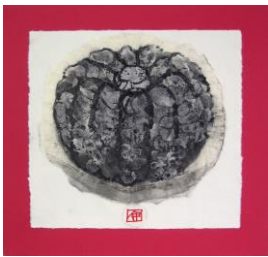
春 9 黒皮カボチャを描く