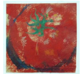
夏 9 野菜の風景画