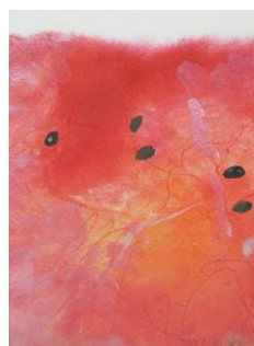
夏 6 スイカの残暑見舞