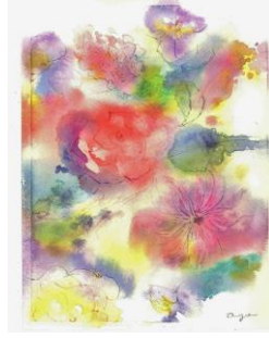
春 3 透明水彩ぬらし絵「花を描く」