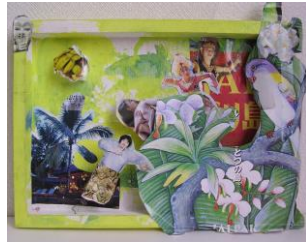
春 6 写真コラージュ(世界旅行)