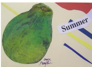
夏 1 トロピカルフルーツの量感画