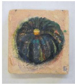
秋 6 テラコッタタイルに描く (ミニカボチャ)