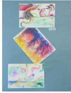
春 2 五感で描くアナログ画