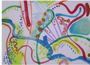
秋 3 五感で描くアナログ画 (秋バージョン)