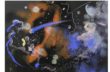
夏 4 宇宙を描く