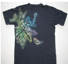
夏 5 Tシャツ「雪の結晶」を描く