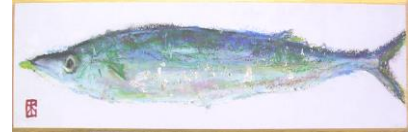
秋 4 さんまの観察画