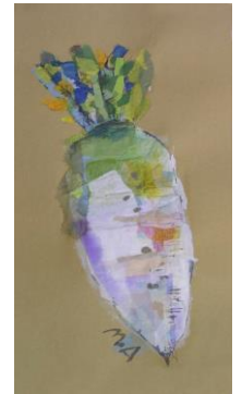
冬 5 青首大根のちぎり絵