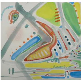
冬 6 アナログ自画像