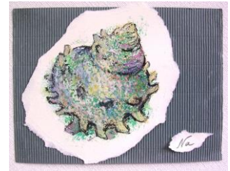
春 8 さざえを描く