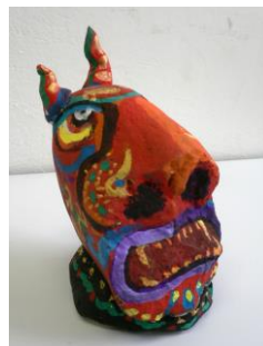
冬 8 節分・鬼をつくる