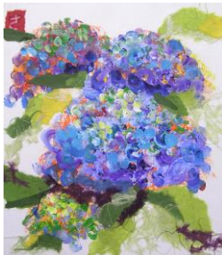
夏 2 スタンプングで描く 紫陽花