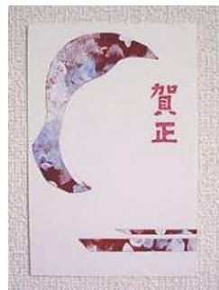
冬 2 年賀状 雪