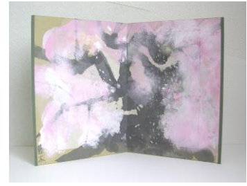
春 4 満開の桜の大木（屏風仕立て）