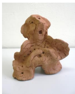
冬 3 土偶