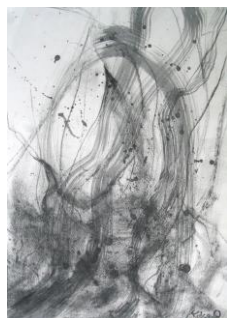
冬 7 風の抽象表現