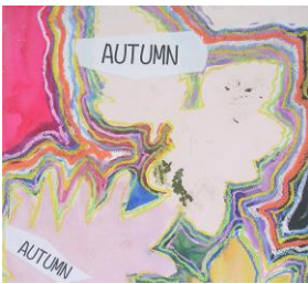
秋 9 ネガボジアナログ画