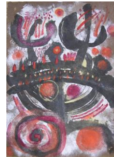
冬 4 描き初め